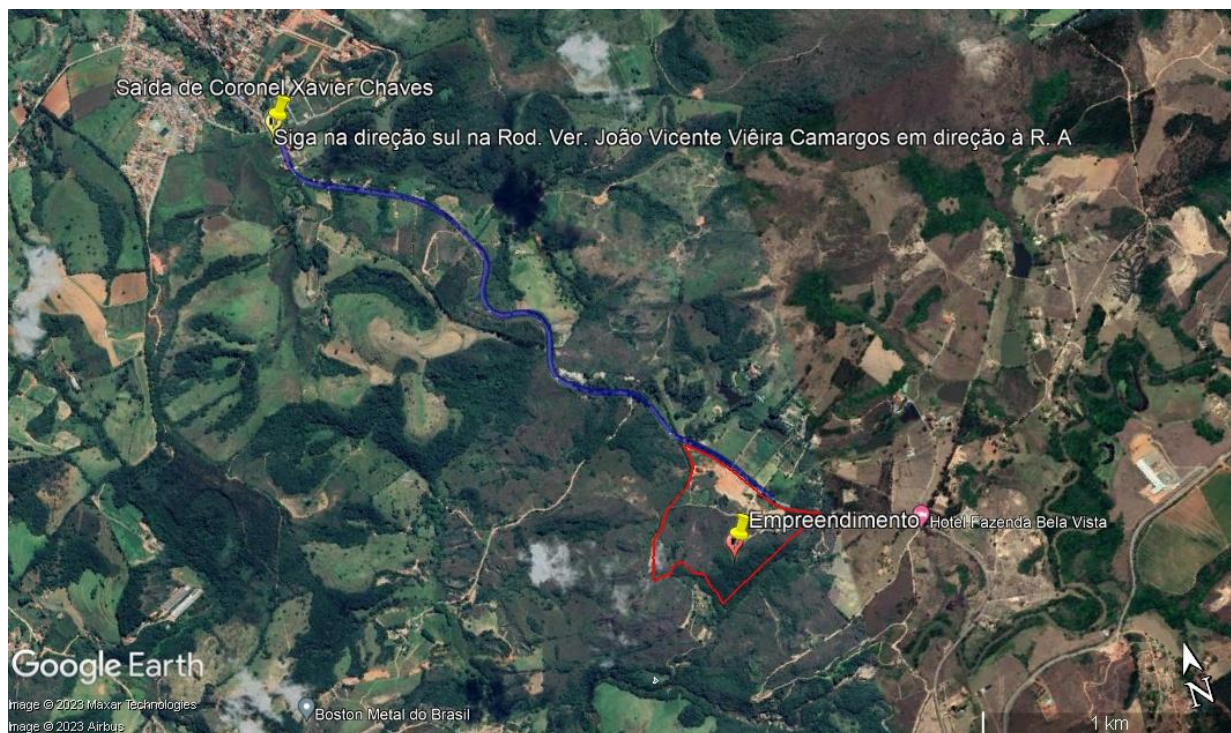
Figure 2. Acesso ao empreendimento saindo de Coronel Xavier Chaves.

Já saindo de Coronel Xavier Chaves, siga na direção sul na Rodovia Ver. João Vicente Vieira Camargos (AMG-0415), ao longo de 2,8 km, com o empreendimento se encontrando à direita da rodovia (Figura 2).